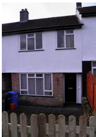
Ffigwr 2: Gwelliannau i eiddo preifat drwy gamau Gorfodaeth