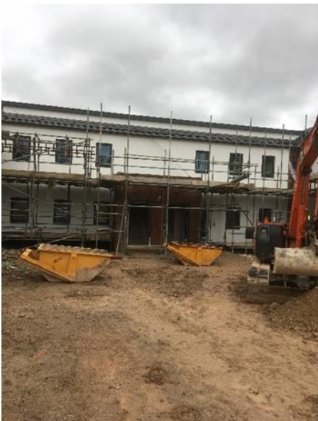
Ffigwr 4: Awel y Dyffryn, Unedau Gofal Ychwanegol Dinbych yn cael ei adeiladu