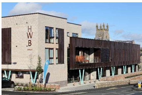
Ffigur 3: HWB Llety a Chanolfan Hyfforddi Pobl Ifanc Ddigartref, Dinbych