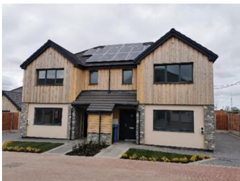
Ffigwr 1: Cynllun Clwyd Alyn yn Llanbedr Dyffryn Clwyd